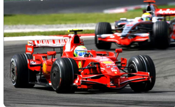
Massa controla Hamilton durante o GP da Turquia de 2008

Entre todos os países dessa lista, a Turquia é o mesmo que recebeu a Fórmula 1 há menos tempo: a última visita da categoria ao circuito de Istanbul Park aconteceu em 2021. Assim como aconteceu com a pista sul-coreana, o tra-