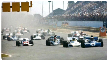
Largada do GP da Argentina em 1972 em Buenos Aires

Tradicionalíssima tanto no futebol quanto no automobilismo, a Argentina já recebia Grandes Prêmios antes mesmo da criação da Fórmula 1. Com o surgimento da categoria e a consagração de nomes como Juan Manuel Fangio e José Froilán González, o país recebeu uma prova oficial da F1 pela primeira vez em 1953, no Autódromo Oscar y Juan Galvez, em Buenos Aires.