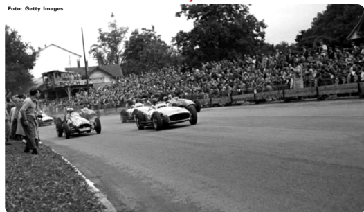
Largada do GP da Suíça de 1964 em Bremgarten

Presente no grupo B da Copa do Mundo, o país europeu recebeu cinco corridas da Fórmula 1, nos cinco anos inaugurais da categoria: de 1950 a 1954. O palco das corridas era o perigoso circuito de Bremgarten — basicamente, um encadeado de curvas de alta velocidade localizada na floresta de mesmo nome, em Berna.