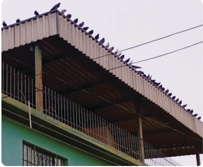
Rua João Carlos, esquina com rua São Felipe no bairro Sagrada Família. Essa foto foi tirada no mês de junho e fez lembrar do famoso filme "Os Pássaros" de Alfred Hitchcock

Para prevenir a transmissão da ornitose, é importante evitar o contato direto com as fezes dos pombos.