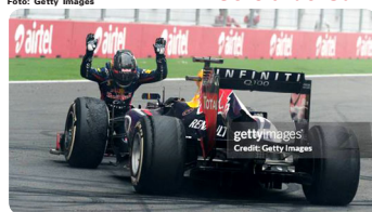
Sebastian Vettel no GP da Coreia do Sul de 2013

Embora não seja um país tão tradicional no esporte a motor, a Coreia do Sul também já teve um circuito para chamar de seu na Fórmula 1: o Circuito Internacional da Coreia, em Yeongam. A pista entrou no calendário da categoria em 2010 após