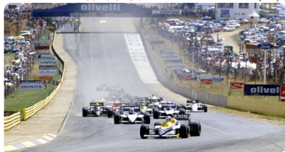
Largada do GP da África do Sul de 1985 em Kyalami

foi constantemente criticada devido ao Apartheid, regime de segregação racial que vigorou no país até 1991. Em 1985, a escalada da violência no país fez com que as equipes francesas Ligier e Renault boicotassem a prova — e esta viria a ser a última corrida na África do Sul até o término do regime.