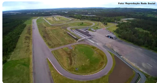
Anderstorp foi o autódromo que recebeu a F1 entre 1973 e 1978 na Suécia

Classificada para a Copa do Mundo após passar pela repescagem europeia, a Suécia também sediou a Fórmula 1 durante seis anos, entre 1973 e 1978. À época, o automobilismo vivia um crescimento de popularidade no país, graças ao piloto Ronnie Peterson. Embora nunca tenha sido campeão da F1, o sueco venceu dez corridas e teve 26 pódios, sendo duas vezes vice da categoria.