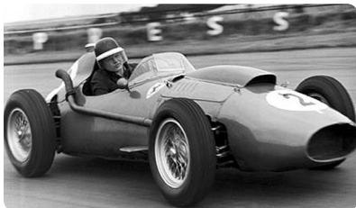
Mik Hawthorn foi campeão da F1 de Marrocos de 1958

Já em 1957, a cidade de Casablanca ganhou uma pista de rua: o circuito de Ain-Diab. No mesmo ano, o local recebeu uma corrida não-oficial da Fórmula 1, vencida por Jean Behra, da Maserati. No ano seguinte, a prova não só passaria a fazer parte do calendá-