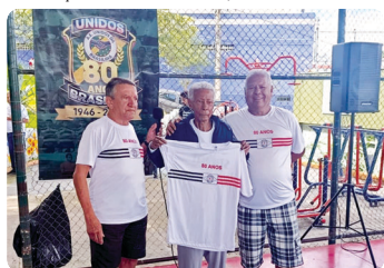
Fotos tiradas no dia 12 de abril em um evento de comemoração dos 80 anos do Esporte Clube Unidos da Brasilina