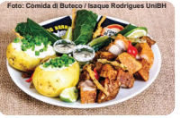
Bem Casados do Bar e Restaurante do Branco

do tem no coração. Crie seu próprio roteiro e aproveite o festival. Você, leitor do Jornal Nossa História Arena, temos duas dicas maravilhosas de pratos mais que saborosos para prestigiar: no Bar du Magrelo, rua São Felipe, 21 e no Bar e Restaurante do Branco, rua Pitangui, 3197.