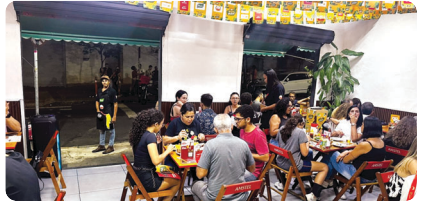
Bar e Restaurante do Branco

do tem no coração. Crie seu próprio roteiro e aproveite o festival. Você, leitor do Jornal Nossa História Arena, temos duas dicas maravilhosas de pratos mais que saborosos para prestigiar: no Bar du Magrelo, rua São Felipe, 21 e no Bar e Restaurante do Branco, rua Pitangui, 3197.