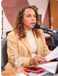
de direitos, além de atendimento médico prioritário e

Entre as medidas previstas estão a promoção de iniciativas para evitar a revitimização, a capacitação continuada de servidores públicos, o encaminhamento imediato ao Ministério Público em casos de violação