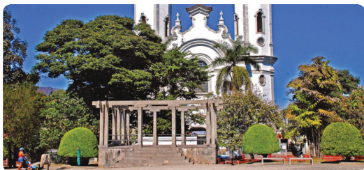
Praça Duque de Caxias - Santa Tereza

para completar, está a Cristiano Machado. Assim, o Sagrada Família se posiciona bem no meio de outros pontos da cidade.