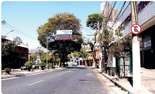
Avenida Silvano Brandão

Vilas de operários, ferroviários e áreas suburbanas deram início à ocupação da regional. Tanto a linha férrea quanto o Ribeirão Arrudas foram elementos de extrema importância para a ocupação da região Leste.