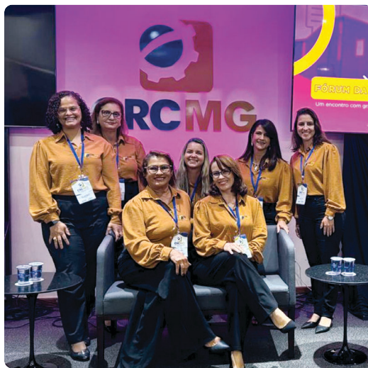
Equipe Conhecer Contábil

tais, garantindo a transparência e a correta aplicação dos recursos públicos.