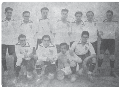
América em 1925