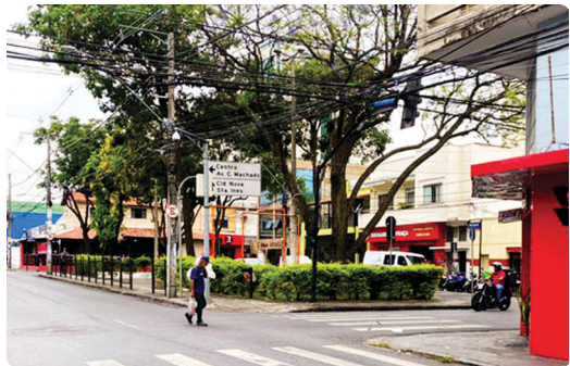
Rua Conselheiro Lafaiete - Sagrada Família