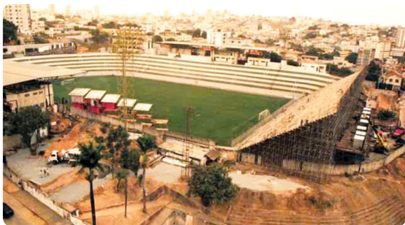
Ano de 1999