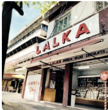
Lalka no bairro Floresta, a primeira fábrica de doces de BH

Conselheiro Lafaiete atravessam o bairro com seus comércios diversificados, a Silvano Brandão abriga o famoso pólo de móveis. Ali ao lado,