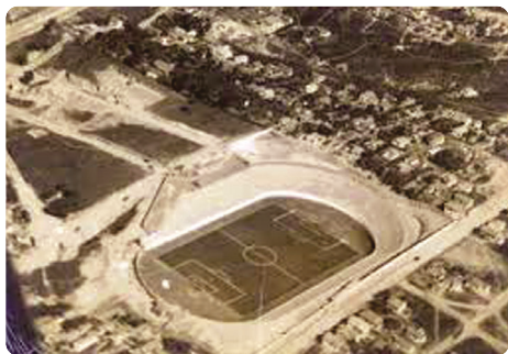
Ano de 1950

Sua história e impacto vão além do campo de futebol e se entrelaçam com a vida e a cultura da comunidade local. Parabéns INDEPENDÊNCIA!