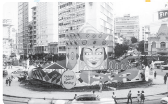
Praça Sete em 1965

A capital Cidade de Minas ganha o nome de Belo Horizonte.