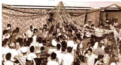
Baile no Minas Tênis em 1961

Surgiram as batalhas de confete e os bailes populares.