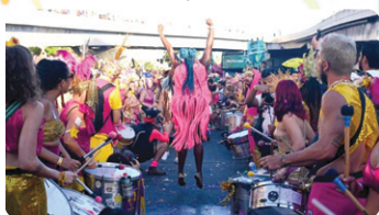
Então Brilha - 2024

Foi um dos melhores carnavais do Brasil. Uma folia que foi para todos os gostos com estrutura, conforto e segurança.