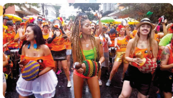
Bloco Volta Belchior em 2019

Com a consolidação do tema "É de todo mundo", as ruas da capital mineira receberam cerca de 4,3 milhões de foliões, durante os 23 dias de período oficial da festa. Mais de 400 blocos fizeram 447 cortejos.