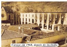
Caraça em 1968, depois do incêndio

Uma das atrações mais famosas do santuário é a visita ilustre do lobo-guará, símbolo do bioma Cerrado e maior canídeo do continente, que costuma dar as caras no adro da igreja, onde são colocadas bandejas com carne para atrair os animais.