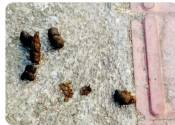
Rua Genevêva de Souza

na, os serviços e o manejo de resíduos sólidos urbanos em Belo Horizonte. De acordo com a Lei 10.534/2012 quem deixa fezes de animais de estimação em vias públicas pode pagar multa. A lei também determina que os dejetos não podem ser jogados em lixeiras públicas e sim em lixeiras específicas dessa destinação ou levados para descarte em casa. Vale lembrar que os parasitas eliminados nas fezes dos animais são, na maioria das vezes, transmissores de doenças que podem se mani-