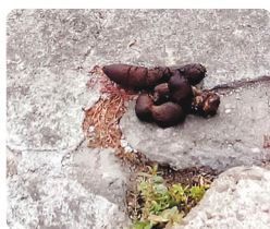
Rua São Felipe