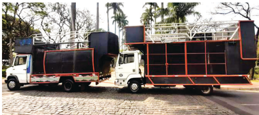
Baturité Trios Elétricos

A equipe do Baturité e do Bloco Cheia de Manias, amigos em comum, destacam que a festa pode ser ainda mais divertida e grandiosa se os organizadores derem mais atenção e ouvirem tanto os grandes quanto os pequenos blocos que fazem do carnaval de BH um evento tão especial.