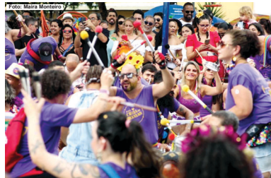
Bloco Cheia de Manias