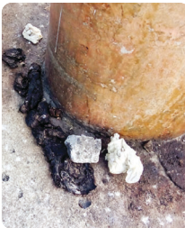
Rua Costa Monteiro

A situação vem extrapolando os pisos de calçadas. Alguns moradores já instalaram placas e faixas orientando o tutor de animais a levar a sujeira de volta para descarte correto.