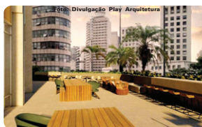
Este ponto do Othon Palace será ideal para observar toda a vista de Belo Horizonte

Assinado pela Play Arquitetura em parceria com a Ar.Lo Arquitetos, o projeto do Afonso Pena 1050 tem como ponto de partida a valorização e o respeito pela história da edificação, evidenciando sua conexão com a cidade, com os moradores e também com os visitantes. Desta forma, o projeto considera a vocação primordial do prédio, que sempre foi a hospitalidade