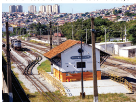
O antigo ramal férreo do bairro Horto

O bairro Horto Florestal, antigo Instituto Agrônomo, não deve ser confundido com o bairro Horto. Apesar dos dois bairros serem vizinhos e seus habitantes guardarem uma história em comum, os dois bairros não são o mesmo, mas muita gente nem sabe.