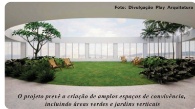
O projeto prevê a criação de amplos espaços de convivência, incluindo áreas verdes e jardins verticais

As obras de instalação e adaptação do Afonso Pena 1050 terão início após aprovação do projeto e trâmites legais junto aos órgãos responsáveis e a expectativa é que o Afonso Pena 1050 fique pronto em aproximadamente 12 meses após o início das intervenções. Em breve, será disponibilizado um site com todas as informações sobre o projeto bem como o lançamento comercial do empreendimento.