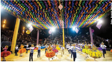
O Arraial de Belo Horizonte, consolidado como a festa mais representativa da cultura junina nas Regiões Sul e Sudeste do Brasil

A festa junina é uma celebração católica a três santos: São João, o mais popular e venerado