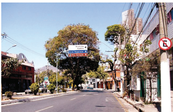
Avenida Silvano Brandão