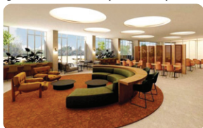
Este ambiente irá possibilitar que as pessoas consigam ter um espaço tranquilo para reuniões

Quem passa pela avenida Afonso Pena, em frente ao prédio que abrigou o Othon Palace Hotel, pode notar algo de diferente na fachada, que já revela algumas pistas de como será o futuro daquele local. A imponente construção, que faz parte da história da capital mineira, se prepara para ganhar uma nova identidade e adianta o que será um dos projetos de ocupação mais interessantes e inclusivos da cidade.