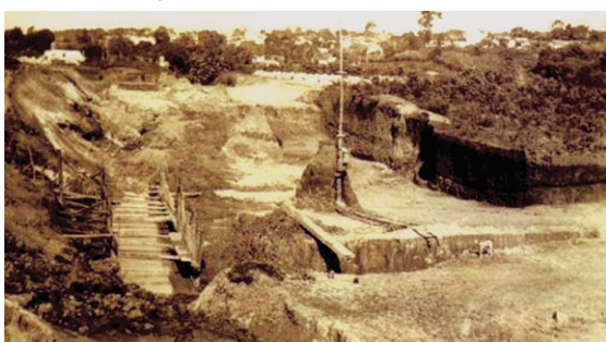
Esta foto de 1942 mostra a canalização do córrego da Mata onde, futuramente, daria origem à Av. Silvano Brandão, importante eixo que liga o bairro Horto ao Sagrada Família